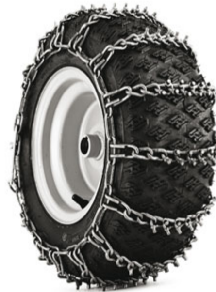
SCHNEEKETTE MIT SPIKES (PAAR) 964 99 30-01